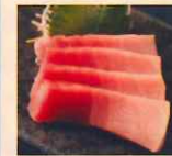
本鮪中トロ 天然1.280円