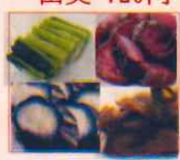
お漬け物 四種 490円