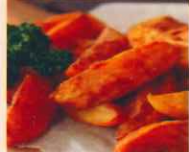
ポテトフライ 手作り 560円