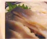
生ホッキ貝 北海道産850円