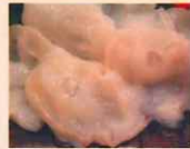
生たこ 北海道産950円