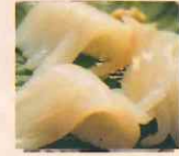
やりいか 北海道産850円