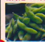
温 十勝 枝豆 茹でたて490円