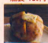
男爵いもバター 520円