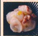
たこわさび 北海道 670円