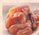
いか 塩辛 前浜 500円