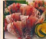
近海 アジ 天然 920円