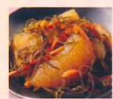
松前 漬け 数の子620円