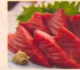
本鮪 赤身 天然 950円