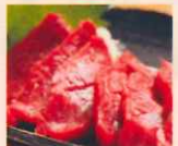
馬 刺し ロース1.080円