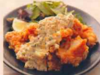
桜姫鶏の甘酢 タルタル 720円