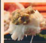
かに 味噌 蟹身入650円