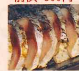
炙り さば 燻製 720円