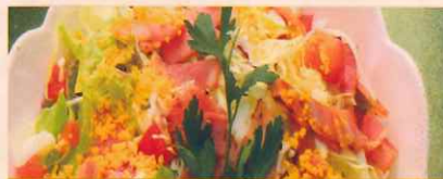
北の家族 サラダ 850円 四種類の野菜やトマト・卵・チーズ