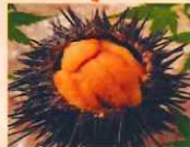
生うに 北方 1.450円