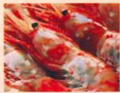
ボタン海老 2尾 1.800円