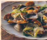
あさり酒蒸し 北海道産 980円